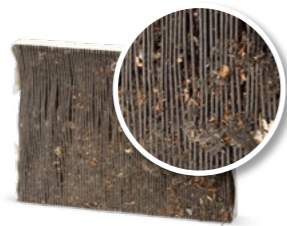
Sans maintenance du système de climatisation