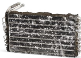
Sans maintenance du système de climatisation