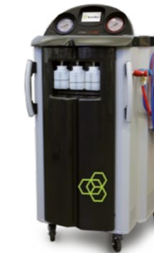
AC-1234 HO Conforme aux spécifications OEM allemand (VDA)