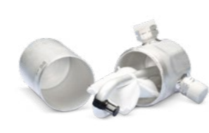
Avec maintenance du système de climatisation