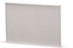
Avec maintenance du système de climatisation