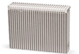
Avec maintenance du système de climatisation